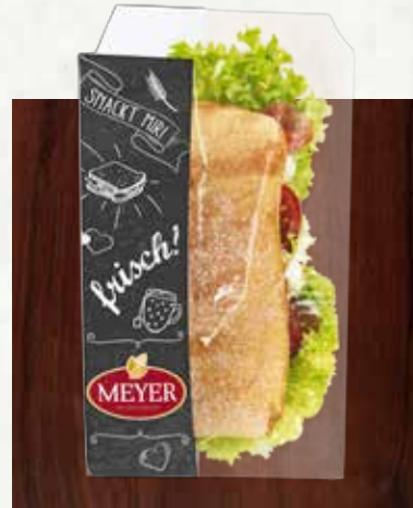
Snackbeutel ermöglichen das Vorverpacken der Backwaren und präsentieren Ihre Snacks gleichzeitig stilvoll.